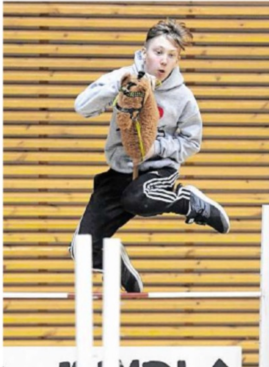
Ein junges Steckenpferdreiterin in Aktion. Hobby-Förising ist ein neuer Trend, der skandinavische Länder wie Finnland gerade erobert.